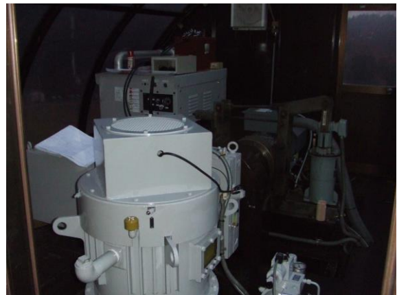
交流原動機・減速機の更新