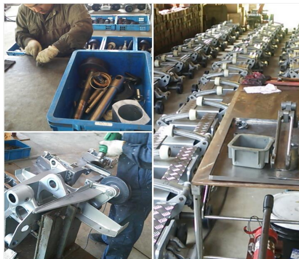
握索機6年検査・分解整備