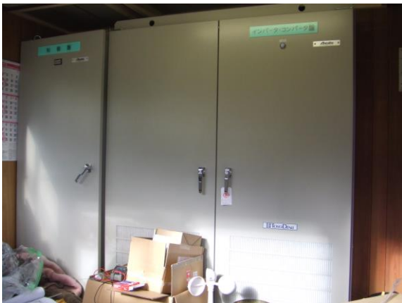
インバーター制御へ更新

平成25年度は、めいほう第2ペアリフトの減速機・原動機・制御装置・滑車軸・ユニバーサルジョイント・滑車用ゴムライナー・電話機をそれぞれ更新し、新たに予備原動機を設置しました。また、油圧緊張シリンダーの分解整備も同時に実施しました。