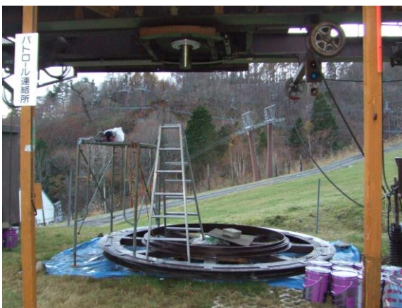
滑車軸・ベアリング更新