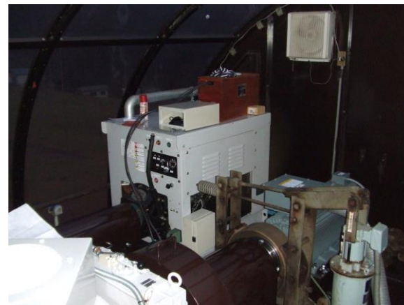
予備原動機を新設