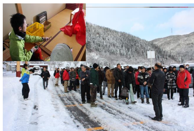
避難訓練と消火訓練

また、索道技術管理者講習会（日鋼協主催）、並びに索道技術講習会に参加による、安全教育を実施しています。