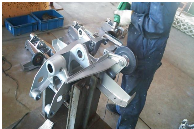
メインパーツ交換作業

その他、めいほう第1、第2クワッドリフト各山頂押送爪を更新、めいほう第1、第2クワッドリフト握索機3年・6年分解整備、めいほう第2クワッドリフトメインパーツ・クランプピースの一部更新、めいほう第3クワッドリフト油圧制動ユニット更新、めいほう第4クワッドリフトユニバーサルジョイント分解整備、めいほう第1・第2ペアリフト握索機分解整備等を実施しました。